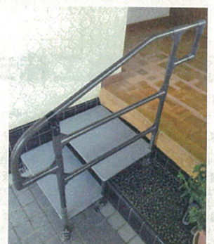
手すりを前後に伸ばす加工も可能です。