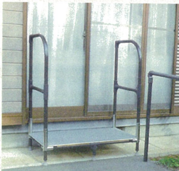
低い段差には1段での製作も可能です。